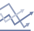
Chart of the day